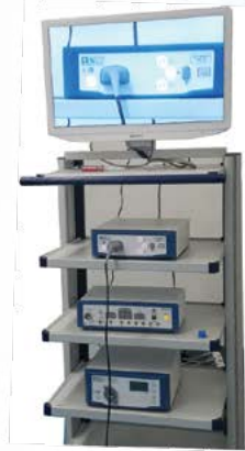
STEMA Laparoscope Unit