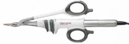
harmonic focus plus