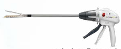
echelon flex endopath