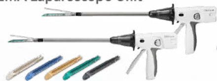
Powered echelon flex