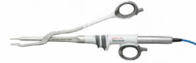
harmonic focus long